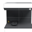
Classic Black & White

Bei CADstar sind alle Scanner individuell in den Farben Pure White , All Black , Manhattan Gray oder Classic Black & White bestellbar. Konfigurieren Sie Ihren individuellen Scanner unter www.cadstar.dental/leistungen/scan-systeme