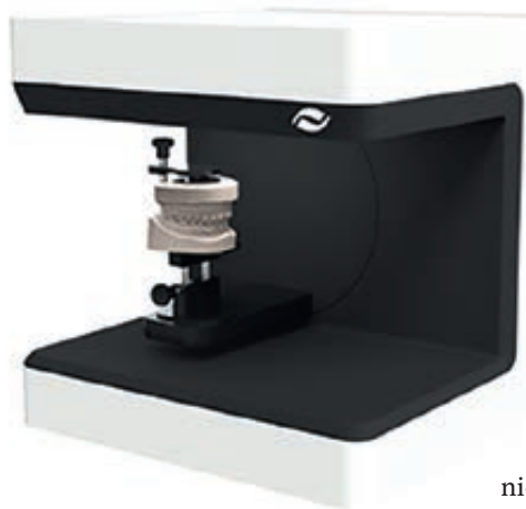
CADstar verarbeitet sowohl analoge, als auch digitale Studiomodelle. Noch optimaler gestaltet sich der Datentransfer mit dem 3D-Scanner „CS ULTRA ORTHO“ von CADstar.

Individualisierte Werbemittel Um staraligner-Anwender bei der Patientenberatung effektiv zu unterstützen produziert CADstar für seine Kunden individualisierte Werbemittel und Informationsmaterial in höchster Qualität. Außerdem steht CADstar seinen Kunden mit Preisempfehlungen, Abrechnungsbeispielen und praktischen Verarbeitungstipps zur Seite. Weitere Informationen auf www.staraligner.at